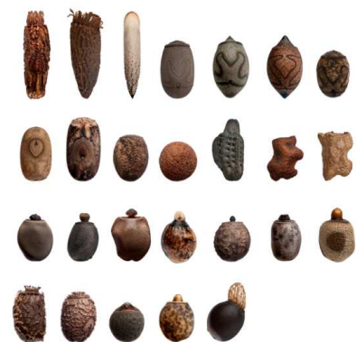
Eieren van verschillende soorten wandelende takken

De mannetjes zijn vaak wat groter dan vrouwtjes. Het mannetje herken je aan de bult die hij aan de onderkant van zijn achterlijf heeft. Een vrouwtje legt per nacht één tot vijftien eieren en in totaal vijftig tot duizend (!) eitjes per periode. Ze kan bevruchte eitjes leggen, zonder dat ze gepaard heeft. Afhankelijk van de soort duurt het twee tot veertien maanden voordat de eitjes uitkomen. Pasgeboren wandelende takken noem je 'nimfen'. Nimfen moeten vijf tot zes keer vervellen totdat ze volwassen zijn. Omdat het vrouwtje heel veel eitjes legt, is het beter om maar een klein deel van de eitjes te bewaren en de rest weg te gooien. De eitjes moet je apart, in een geschikt klimaat bewaren. Hoe dat precies gaat kun je in de dierspecialzaak vragen!